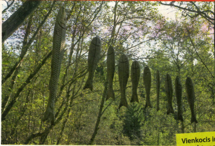
Vienkocis ir jebkas, kas izgriezts no viena koka