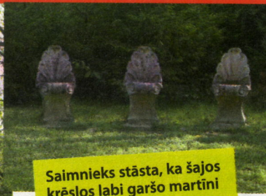
Saimnieks stāsta, ka šajos krēslos labi garšo martīni